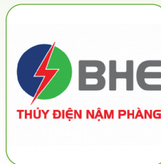
CTCP Năng lượng Bắc Hà