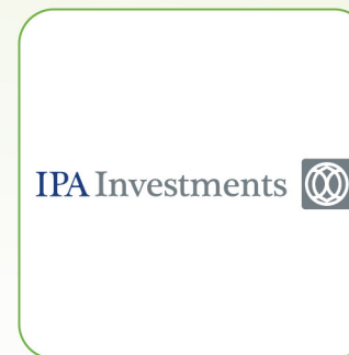
CTCP Tập đoàn Đầu tư I.P.A