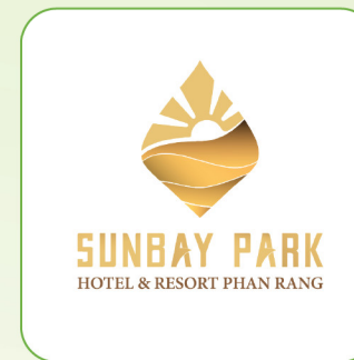
CTCP SunBay Ninh Thuận